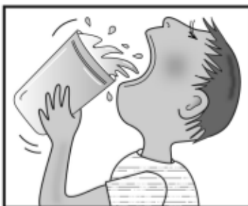
Sete estrema/ bocca asciutta