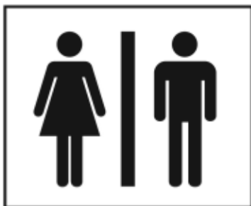
Minzione frequente (enuresi notturna nei bambini)

Un individuo può non riconoscere i sintomi di glicemia alta. Questi sono i sintomi più comuni che possono indicare un'iper glicemia.